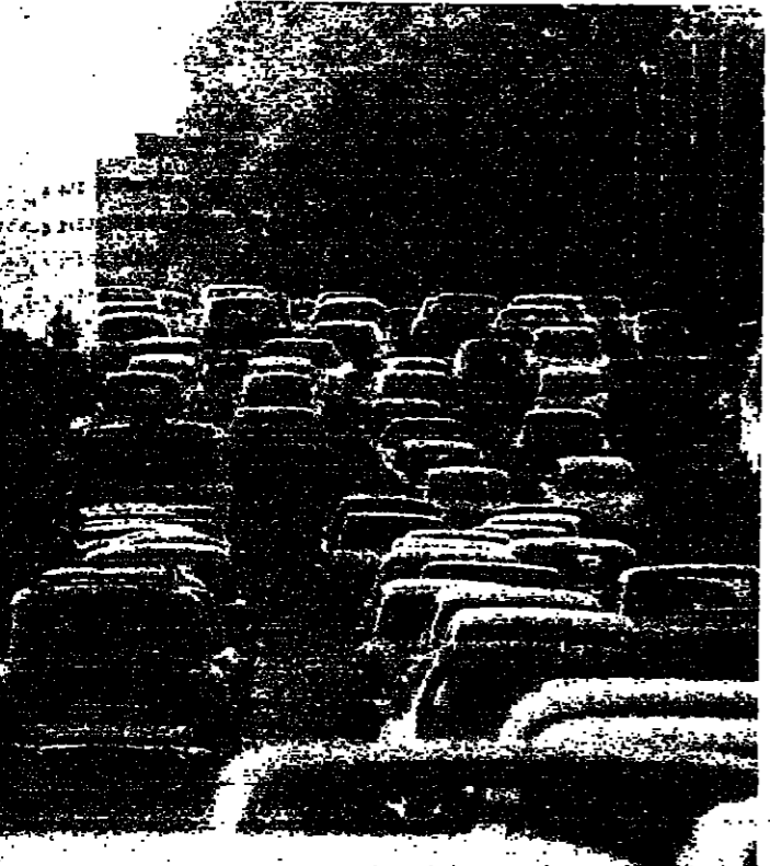
■ مدخل بيروت الشمالي : ازدهام دائم ■